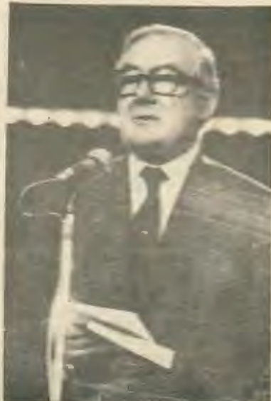
Ο Πρωθυπουργός Κάλλοχαν.

Όσοι οι Συντηρητικοί δεν φαίνεται να επιδιώκουν την άμεση ανατροπή της Κυβέρνησης. Ξέρουν πολύ καλά πως θάνατο αδύνατο να λύσουν τα προβλήματα της χώρας οι Λόρδοι και έτσι προτιμούν να εξαναγκάσουν την Εργατική Κυβέρνηση να παίρνει την ευθύνη για τα ανεργατικά μέτρα που χρειάζονται για την